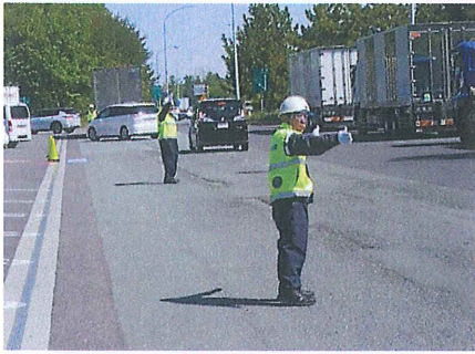
地域の安心・安全を繋ぐ架け橋